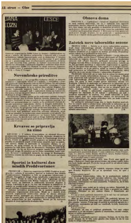
• Vir: Glasilo socialistične zveze delovnega ljudstva za Gorenjsko, 9.11.1976

Dvanajsto nadstropje je bila slovenska pop glasbena skupina, ki je delovala v osemdesetih letih 20. stoletja.