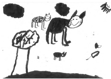
• Ilustracija: Oskar

V njem so se izmenjevali občutki navdušenja, izgubljenosti, radovednosti in previdnosti. Ni vedel, kaj bi najprej povohal, ali bo ta čudna stvar kaj naredila, ali bo pri miru, ali gre lahko v tisto sobo, ali lahko potaca prijetno odejico, naj skoči na omarico, naj se kar uleže in počiva? Slednje je šlo prav dobro človeškemu staršu, ki je nekaj časa nosil okoli škatle – ne tiste prijetne škatle iz kartona, temveč neke čudne zavoje in škatle, polne nepomembnih stvari. Štručko je pomagal, kolikor je lahko. Vsakič je skočil na zaboje ali pa se posmukal človeku pod nogami, saj je vedel, kako ga to razveseljuje – še posebej, ko kaj prenaša okoli. Človek je nato očitno našel svoj prostor in se v neklobčiču, značilnemu za ljudi, zleknil in zaspal. »Torej bo najbolje, da jaz storim isto,« si je mislil Štručko in poiskal primeren prostor za klobčič in počitek. Tako je mislil, pa je kmalu videl, da na tem mestu ne bo miru, saj je človeška mama stalno nekaj postopala okoli in na sploh ni dala miru. »Očitno išče svoj prostor za neklobčič,« si je mislil in se odločil: »Najbolje, da poiščem drugo mesto.« Tako se je prestavil, pa mu zopet ni bilo všeč, saj je od nekje pihalo, in se je zopet prestavil, pa mu je bilo tam prevroče. Skoraj bi že obupal, ko je koooončno dobil hrano – celo uro je čakal na obrok, mogoče celo dve!