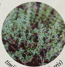
timijan ( Thymus vulgaris )