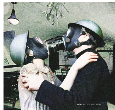
Naslovna fotografija albuma je nastala nekje v Kranju leta 1918.