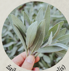
žajbelj ( Salvia officinalis )