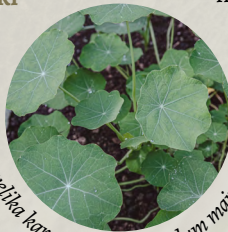
velika kapucinka ( Tropaeolum majus )